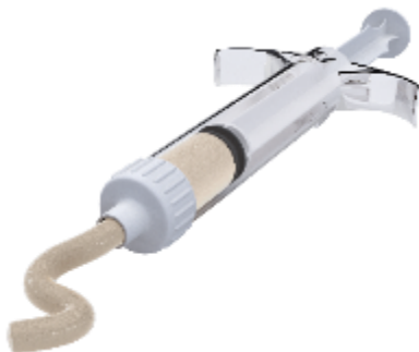
Картина на спринцовка, както е представена в брошурата