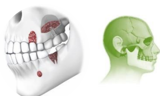
BiologicGlass Bioactive Bone Substitute