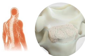
GlassBone ® Bioactive Bone Substitute