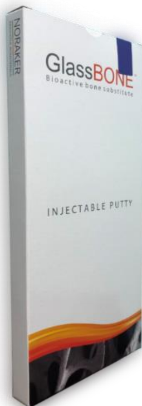
Image de la boîte contenant les sachets et la seringue (côté non étiqueté)