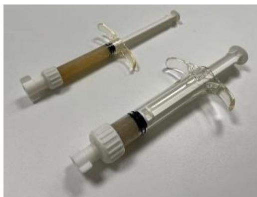
Image d'une petite et moyenne seringue contenant le putty