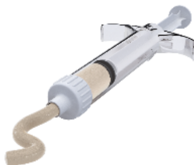
Image d'une seringue telle que représentée dans une brochure