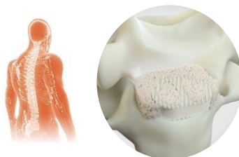
GlassBone ® Bioactive Bone Substitute