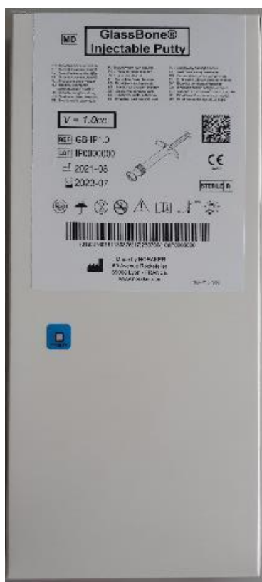
Foto's van de kartonnen doos die de zakken en de spuit bevatten (kant met etiket)