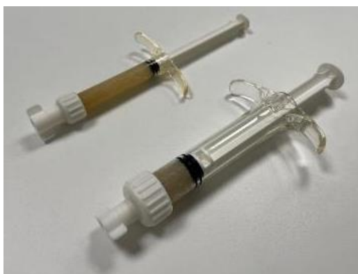
Foto van kleine en middelgrote spuiten die de putty bevatten