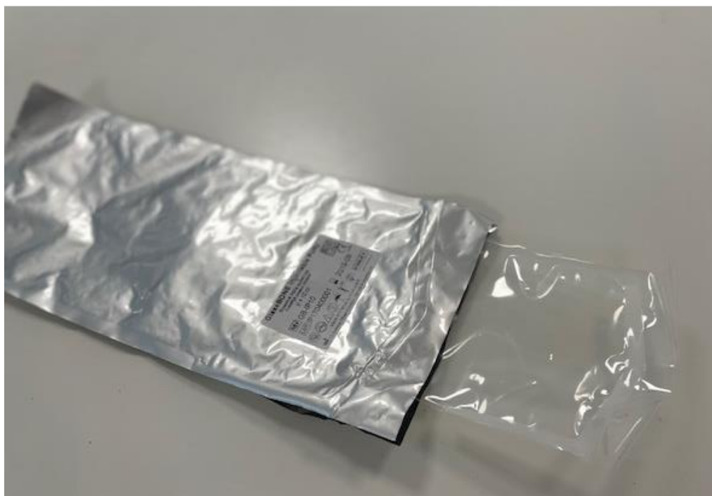
Foto van de zakken (alleen de buitenste zak is de steriele barrière)