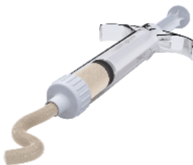
Foto van een spuit zoals weergegeven in de brochure