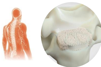
GlassBone ® Bioactive Bone Substitute