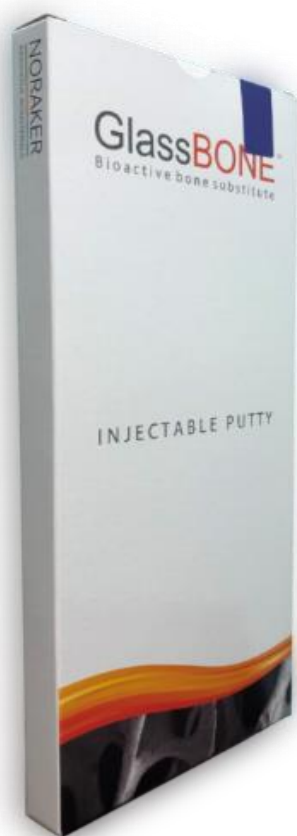
Slika kartonske škatle z vrečkami in brizgo (neoznačena stran)