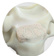
GlassBone ® Bioactive Bone Substitute