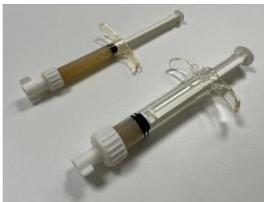
Slika male i srednje štrcaljke koje sadržavaju koštanu pastu