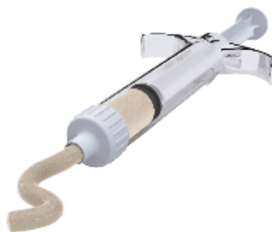
Foto van een spuit zoals weergegeven in de brochure