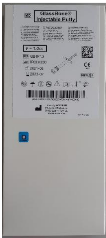
Foto's van de kartonnen doos die de zakken en de spuit bevatten (kant met etiket)