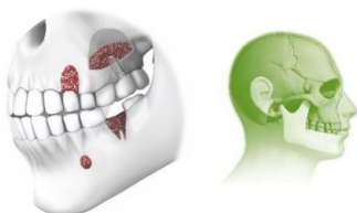
BiologicGlass Bioactive Bone Substitute