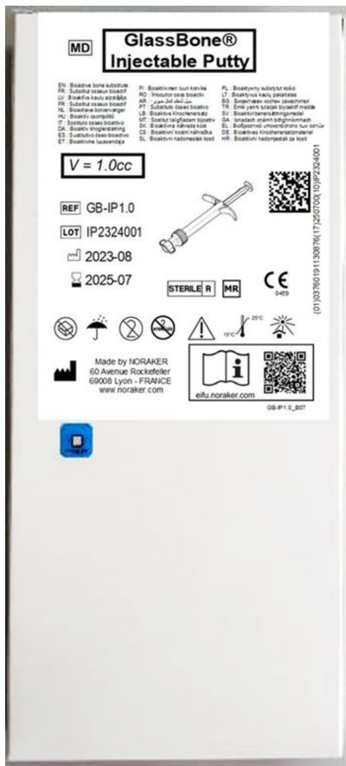
Image de la boîte contenant les sachets et la seringue (côté étiqueté)