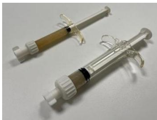
Image d'une petite et moyenne seringue contenant le putty