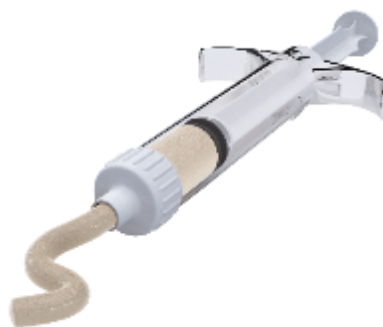
Image d'une seringue telle que représentée dans une brochure