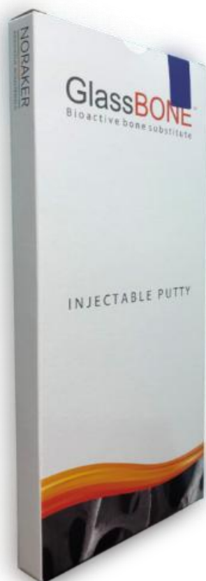
Imagem da caixa de papelão contendo as bolsas e a seringa (lado não rotulado)